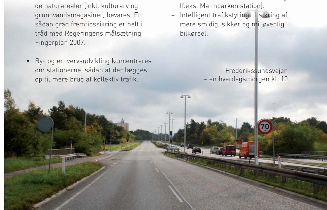
Frederikssundsvejen - en hverdagsmorgen kl. 10